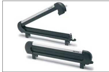
17 Skiträger Porte-skis Portasci