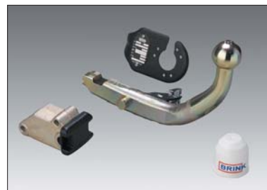
7 Anhänger-Zugvorrichtung Crochet d'attelage Gancio per rimorchio