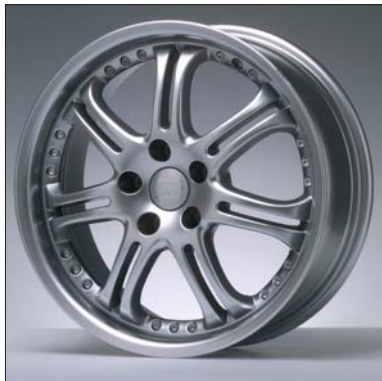
2 Alu-Felge Jante en alu Cerchi in lega