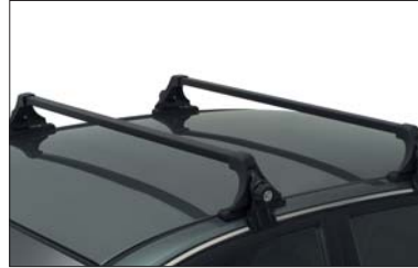
16 Lastenträger Porte-charge Barre portatutto