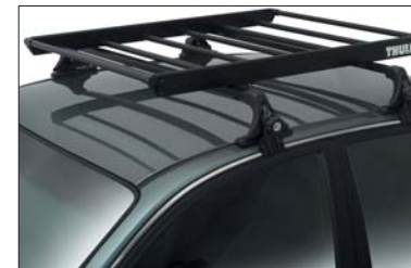
21 Gepäckträger Porte-bagages Portabagagli