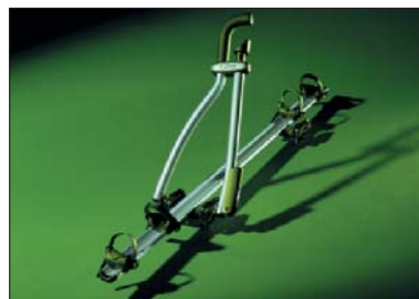
19 Veloträger Porte-vélo Portaciclo