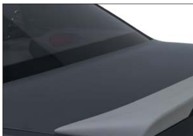
3 Heckspoiler Spoiler arrière Spoiler posteriore