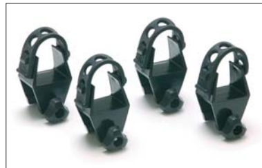
18 Skigreifer + Snow Board- träger Support de skis + porte- Snow Board Portasci + porta Snow Board