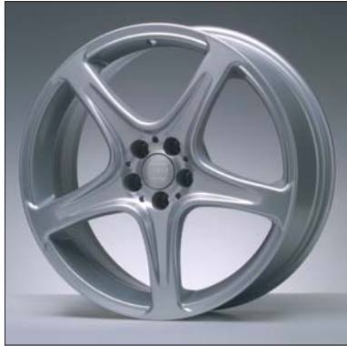
1 Alu-Felge Jante en alu Cerchi in lega