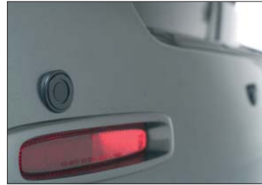
5 Parkpilot hinten Témoin de marche arrière Sensore retromarcia