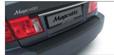
11 Ladekantenschutzfolie Protection de rebord de coffre Protezione spigolo bagagliaio