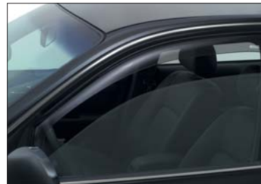
6 Windabweiser vorne Jeu de deflecteur avant Set paravento anteriore