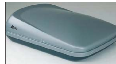
22 Dachbox Coffre de toit Baule da tetto