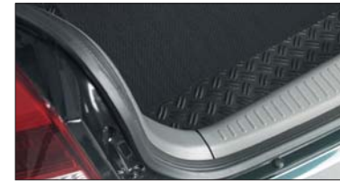
9 Laderaum-Gummimatte Tapis en caoutchouc Tappeto in gomma