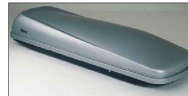
23 Winterdachbox Coffre de toit Baule da tetto