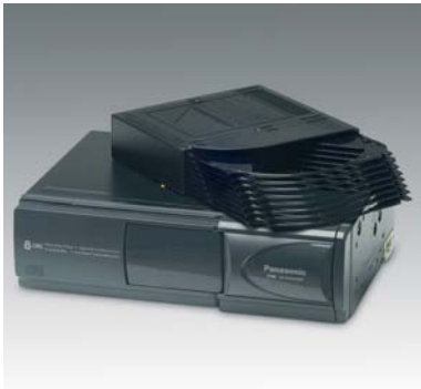
14 CD-Wechsler Changeur CD Cambiadischi CD Panasonic CX-DP88