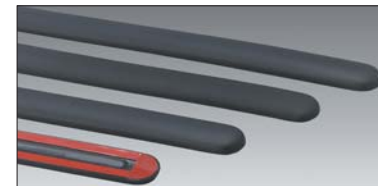
10 Stosstangeneckschutz Moules de protection de pare-chocs Protettori laterali per paraurto