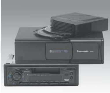
13 CD-Wechsler-Set Set changeur CD Set cambiadischi CD Panasonic CQ-CDP15288