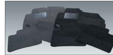
8 Teppich-Satz Jeu de tapis Set tappetini