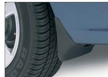
12 Kotschutzlappen-Satz Jeu de bavettes Paraspruzzi