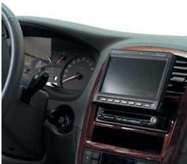
15 Navigationssystem Systeme de navigation Sistema di navigazione