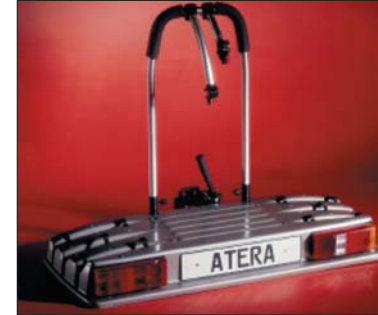
20 Veloträger zu Zugvorrichtung Porte-vélo pour crochet d'attelage Portaciclo per gancio rimorchio